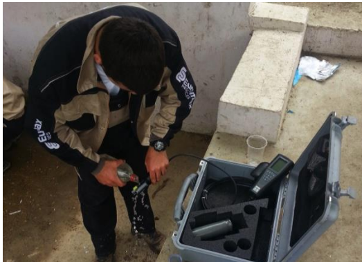
Тестирање на примероци на вода земени од еден од бунарите во селото Иловица.