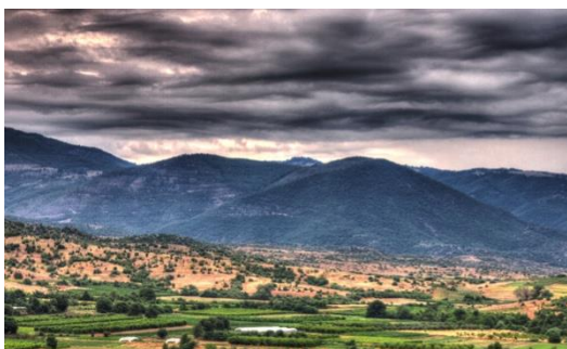
Поглед од запад накај ридот каде е лоцирано наоѓалиштето Иловица.