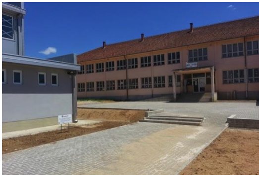
Во Иловица моментално се гради нов училиштен двор, проект кој е поддржан од страна на Еуромакс.